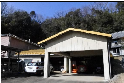
▲車庫及び農器具用倉庫