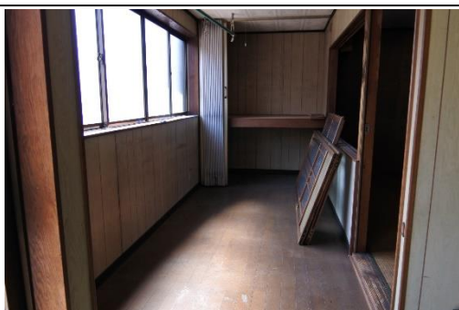
▲玄関横の事業所スペース