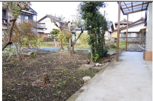
▲家庭菜園（物件裏側）