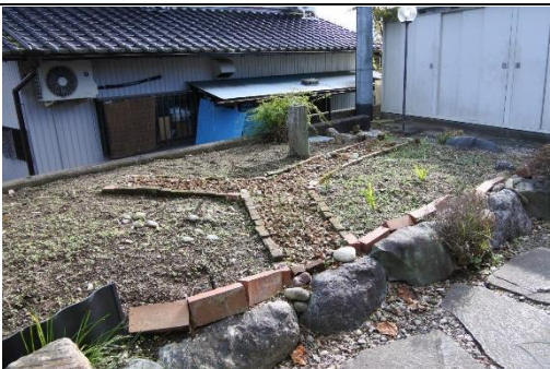
▲家庭菜園（物件正面側）