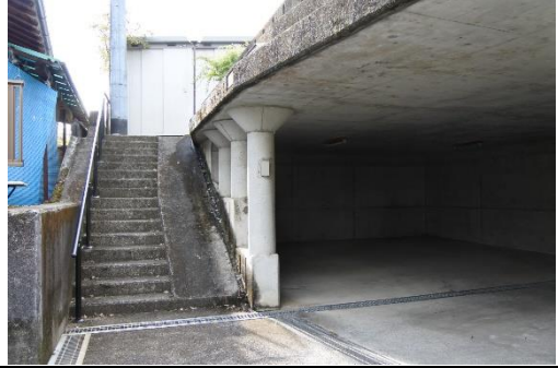
▲駐車場（物件の下部）