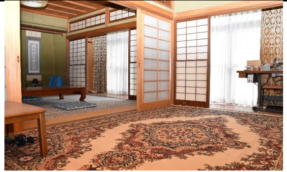
▲和室 (手前 : 6畳、奥 : 8畳)