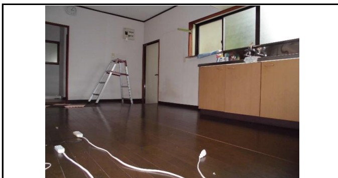
▲ダイニングキッチン