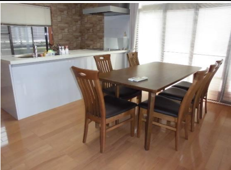
▲ダイニングキッチン