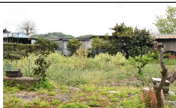
▲家の裏 (地目 : 田)