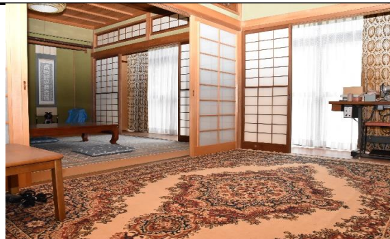
▲和室 (手前 : 6畳、奥 : 8畳)